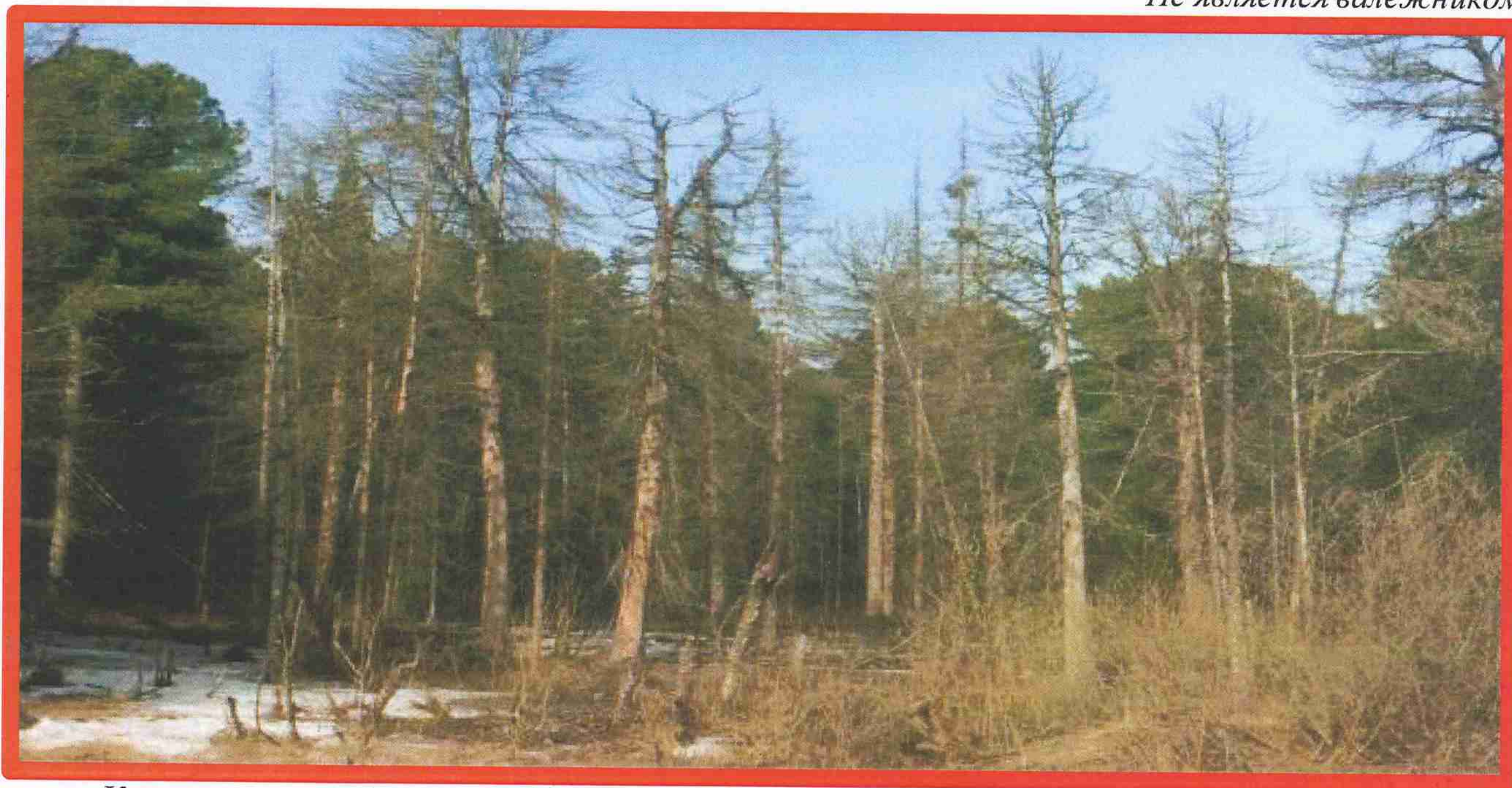
Изображение № 4 Сухостойное дерево. Не является валежником

Кроме того, необходимо обратить внимание, что деревья, которые лежат на земле, но не имеют признаков естественного отмирания (имеют зеленую листву или хвою), определять как «мертвые» не допускается (смотри изображение № 5).