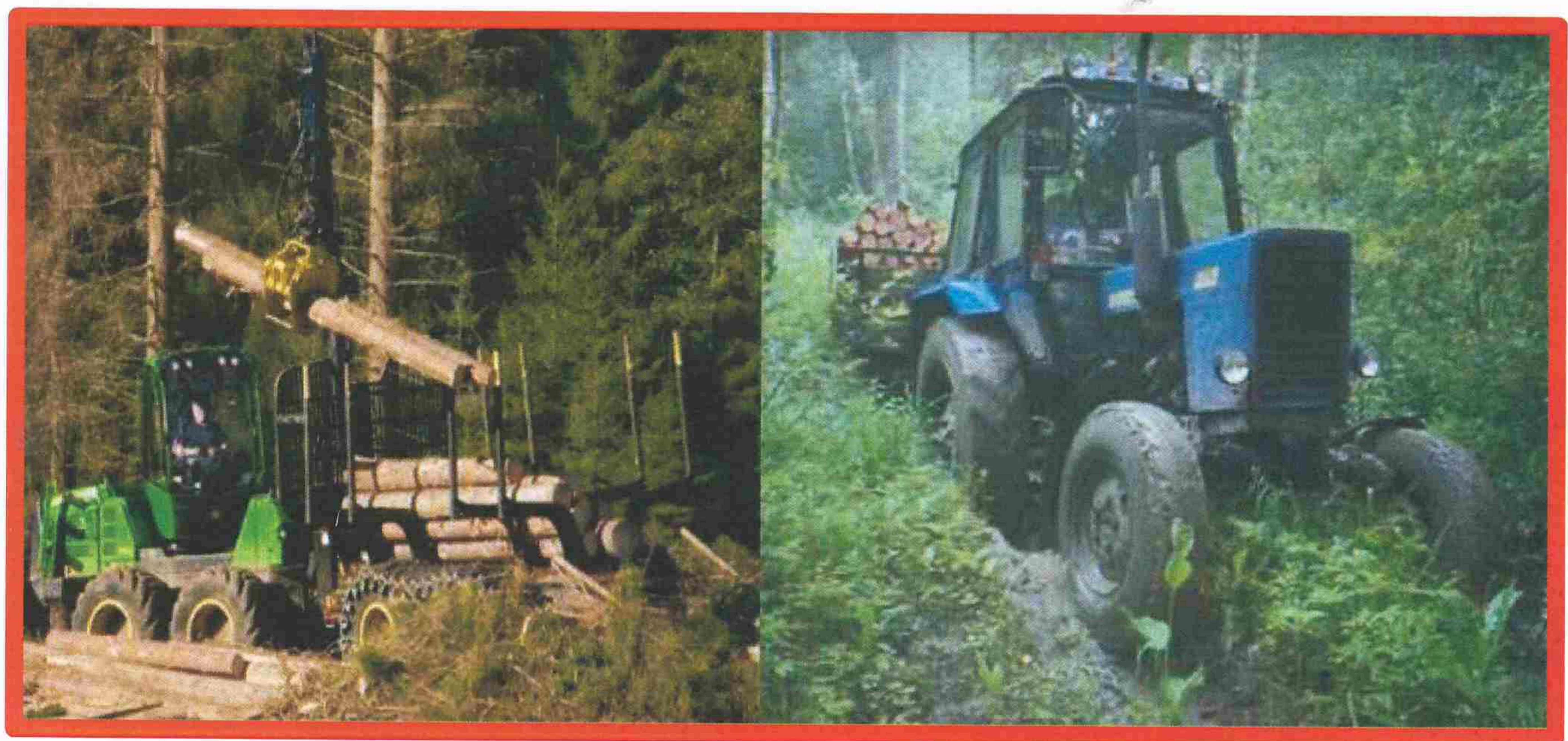
Изображение № 9 Специализированная техника. Использование для заготовки валежника запрещено

При заготовке валежника не допускается повреждение почвенного покрова, подроста и молодняка ценных пород, лесных культур.