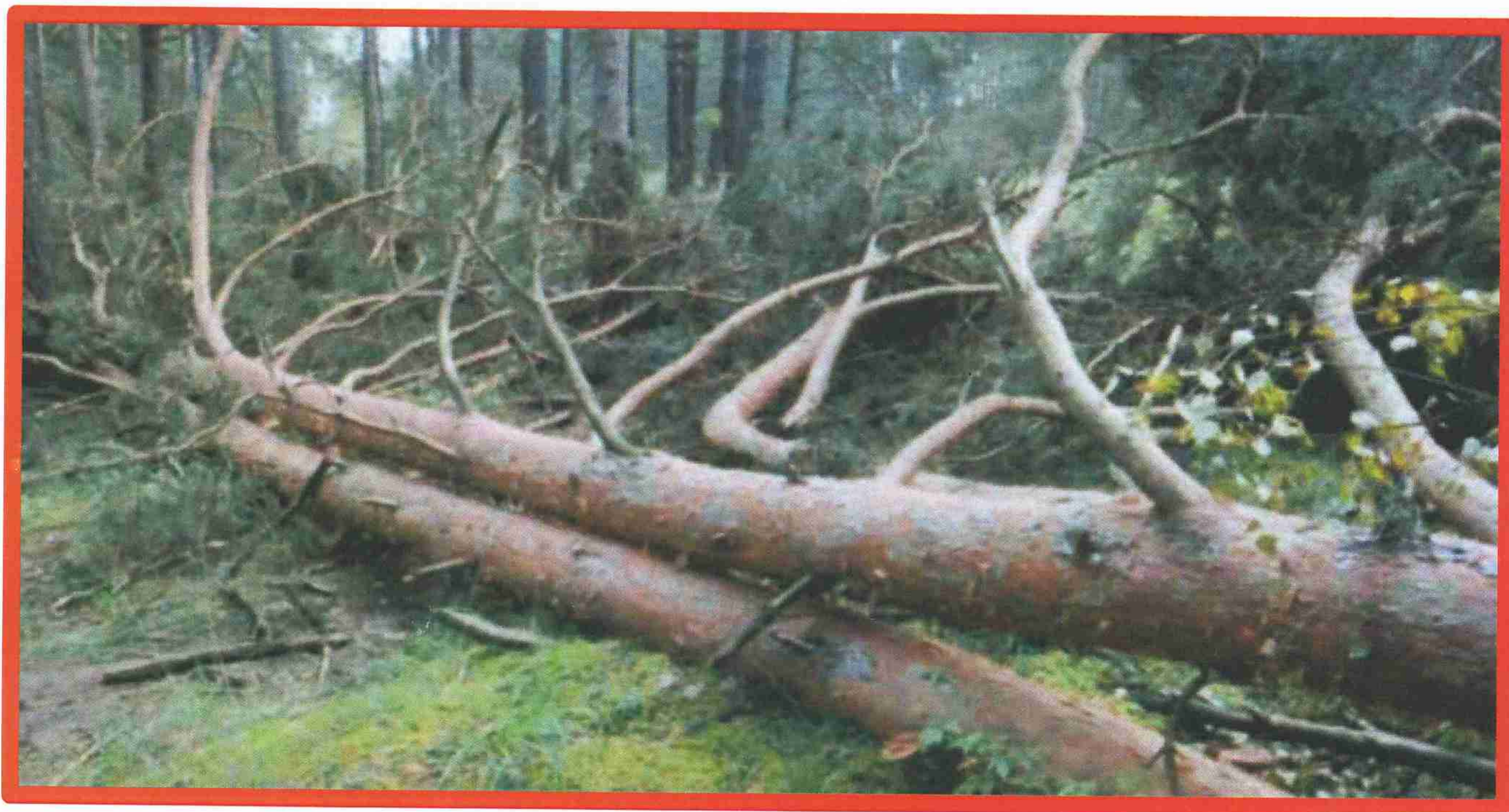
Изображение № 5 Лежащее на поверхности земли ветровальное дерево, не имеющее признаков отмирания. Не является валежником

Ветровальные деревья (вывернутые с корневищем) не являются мертвыми деревьями, хотя они лежат на земле, но могут продолжать жить, расти и даже давать потомство (вегетативное).