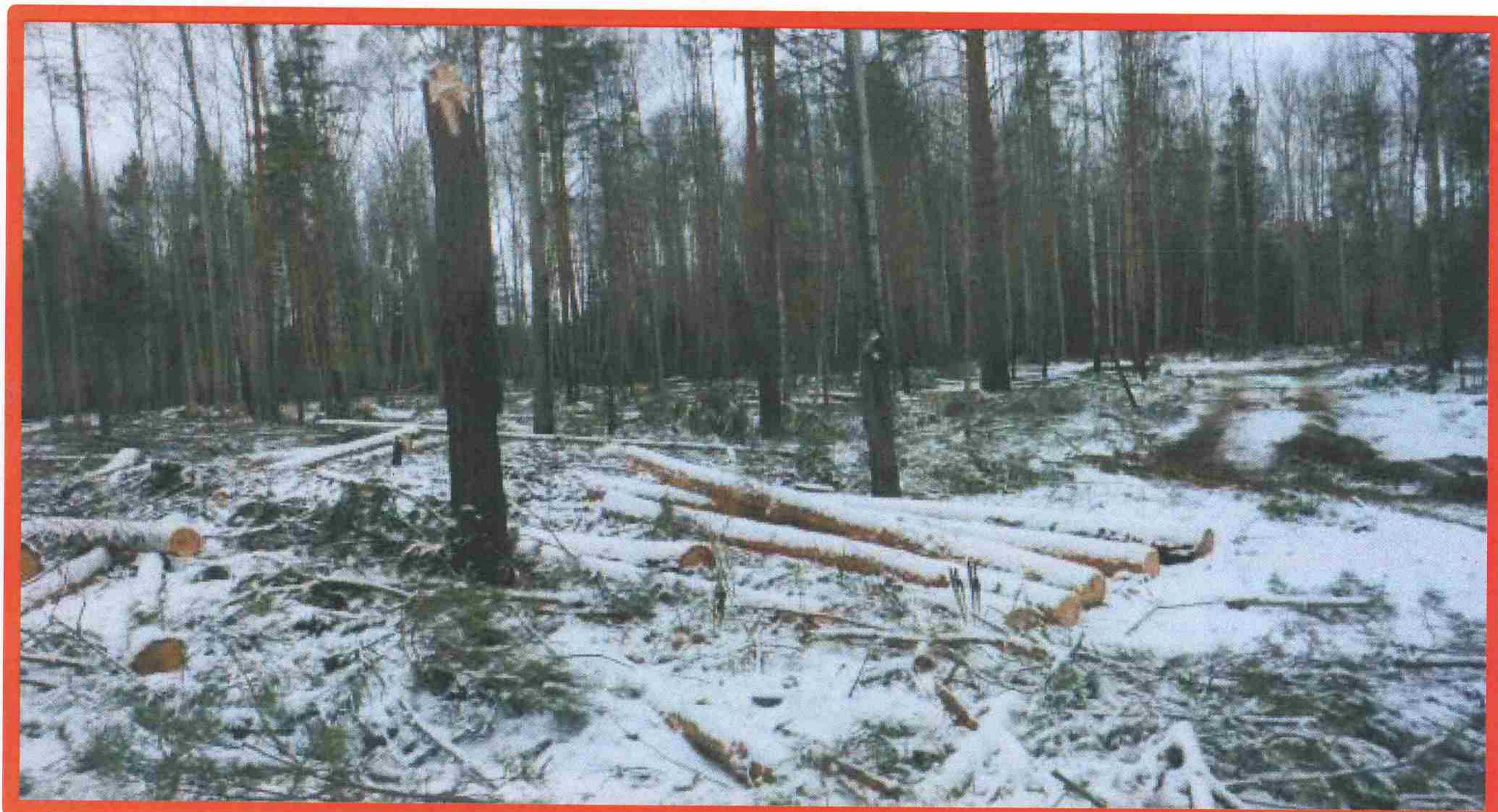
Изображение № 7 Брошенная древесина вдоль лесовозных дорог. Не является валежником